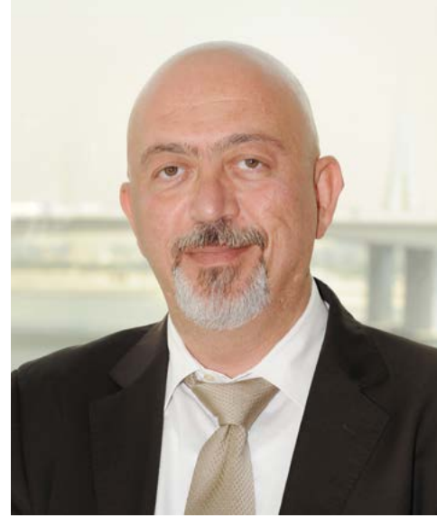
الاختصاصات ومجالات العمل.

دبي، وبرنامج الشيخ زايد للإسكان، وطيوان الإمارات، والإمارات لتموين الطائرات، ومطارات دبي، ومطار المكتوم، وبريد الإمارات وإينوك، وبتروال الإمارات، ودي باركس، علاوةً على كارفور ومكدونالدز وكرافيا وأمريكانا، وكذلك مجموعة من الأندية الرياضية، وعدد من الكليات والجامعات والمعاهد الجامعية.