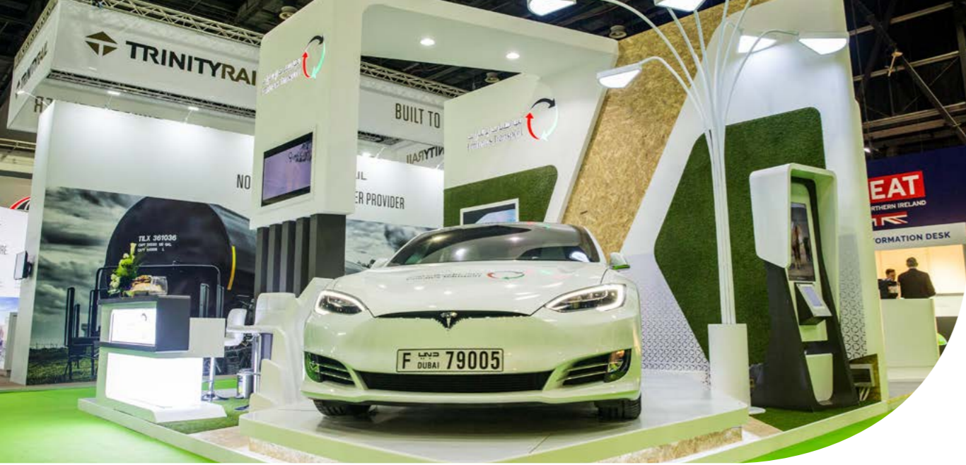
استعرضت مركبة كهربائية بالتعاون مع "تسلا"

ويثبت أن جهودها في هذا الجانب إنما تتبع استراتيجية واضحة تقوم على فهم واضح للاحتياجات الحالية والمستقبلية لكافة الفئات المعنية، وقد مثل تقييم مجال مكان العمل والبيئة والجهود تجاه المجتمع المحلي نقاط القوة الرئيسية للمؤسسة في حين سجل مجال السوق النتيجة الأقل نسبياً. وتضاف علامة غرفة دبي للمسؤولية الاجتماعية إلى رصيد كبير تتمتع به مواصلات الإمارات في مجالات المسؤولية المجتمعية، حيث فازت على امتداد السنوات الماضية بعدد غير قليل من الجوائز المرموقة ذات الصلة بهذا الجانب محلياً وإقليمياً وعالمياً، وتعتبر من المؤسسات الرائدة مجتمعياً على مستوى الدولة.